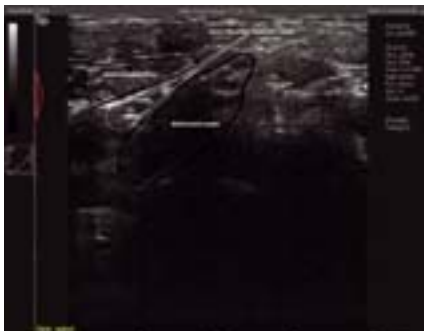
Rycina 6.15 A i B.

A. Identyfikacja splotu ramiennego z dostępu szyjnego przy użyciu USG. B. Obraz splotu ramiennego z dostępu szyjnego (plaster miodu); widoczna igła, przez którą podawany jest LZP (obraz USG opracował dr T. Wiśniewski).