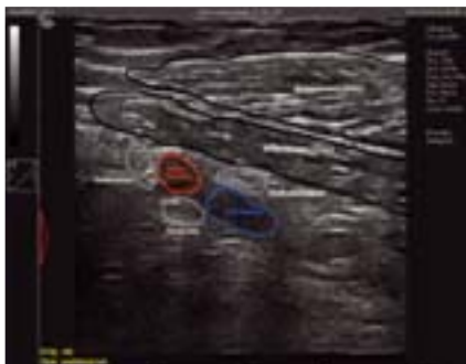
Rycina 6.17 A i B.

A. Identyfikacja splotu ramiennego z dostępu podobojczykowego przy użyciu USG.