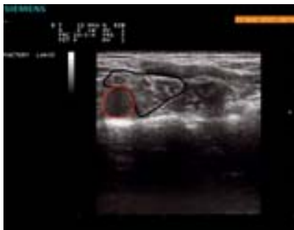
Rycina 6.16 A i B.

A. Identyfikacja splotu ramiennego z dostępu nadobojczykowego przy użyciu USG. B. Obraz splotu ramiennego z dostępu nadobojczykowego (plaster miodu); widoczna igła, przez którą podawany jest LZP (obraz USG opracował dr T. Wiśniewski).